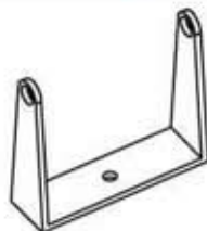
Staffa in acciaio INOX